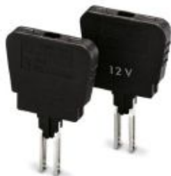
Sicherungsstecker, Nennstrom: 6,3 A, Länge: 33,1 mm, Breite: 6,1 mm, Höhe: 45,7 mm, Farbe: schwarz

Bitte beachten Sie, dass die hier angegebenen Daten dem Online-Katalog entnommen sind. Die vollständigen Informationen und Daten entnehmen Sie bitte der Anwenderdokumentation. Es gelten die Allgemeinen Nutzungsbedingungen für Internet-Downloads. ( http://phoenixcontact.de/download )